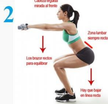
Sentadillas 20 segundos