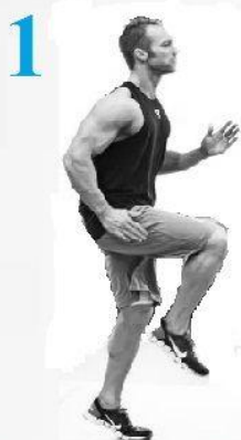
Elevación de Rodillas 20 segundos SKIPPING

NIVEL I - 5 rondas NIVEL II - 10 rondas NIVEL III - 15 rondas 1 minuto de descanso entre rondas