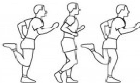
contra-skiping 20 segundos