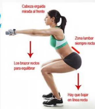
Sentadillas 20 segundos