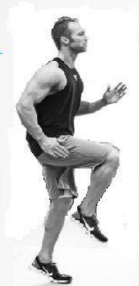
Elevación de Rodillas 20 segundos