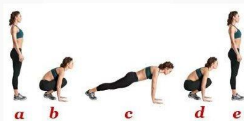
Burpees sencillos 20 segundos